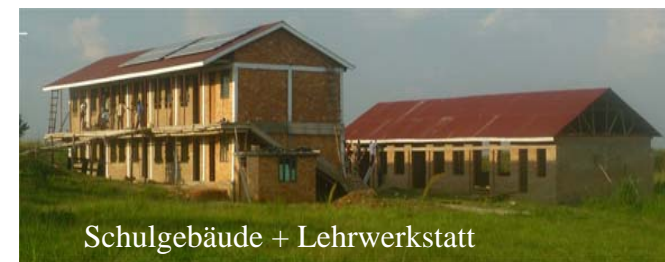
Schulgebäude + Lehrwerkstatt

Mehrere Sponsoren konnten wir jedoch überzeugen, dass unser Konzept richtig ist. Sie haben in diesem Jahr über 200 000 € an Geldern und Sachwerten in dieses Projekt investiert.