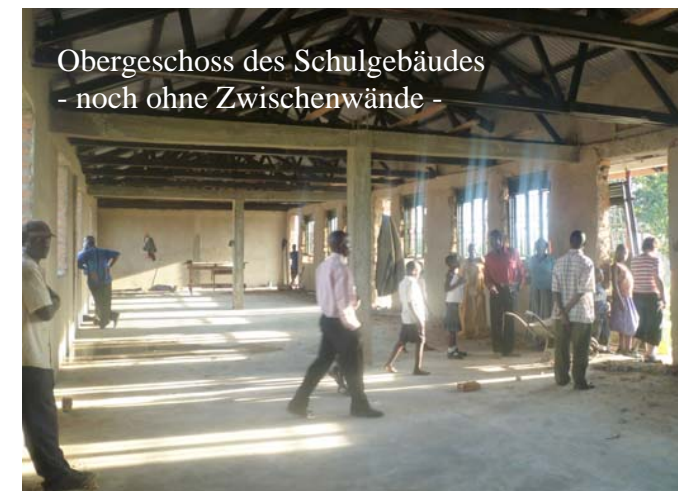
Obergeschoss des Schulgebäudes - noch ohne Zwischenwände -

In nur acht Monaten Bauzeit entstanden durch Father Rogers und sein Team das Schulgebäude und die Lehrwerkstatt. Respekt!